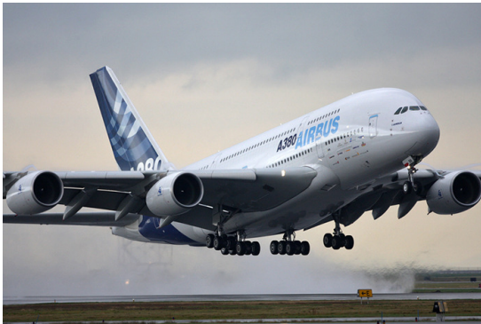
Atterrissage de l'A380 à Genève

L'avion descend sur une pente finale stabilisée à la vitesse d'atterrissage .