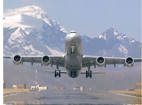
Decollage de l'A340 à La Paz (4000 m de hauteur)

Le décollage se termine au passage à la hauteur de 15 m par rapport au sol.