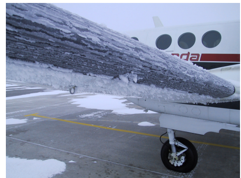
Givrage en vol

Sous l'effet du choc contre les parois de l'avion exposées au vent relatif (nez, bord d'attaque des ailes, entrée d'air des moteurs, hélices...), l'eau liquide se transforme en glace qui s'accumule sur l'avion.