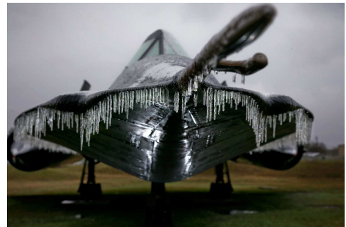
Givrage au sol