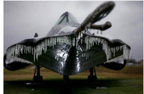
Givrage au sol