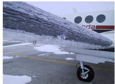
Givrage en vol

Sous l'effet du choc contre les parois de l'avion exposées au vent relatif (nez, bord d'attaque des ailes, entrée d'air des moteurs, hélices...), l'eau liquide se transforme en glace qui s'accumule sur l'avion.