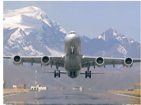
Decollage de l'A340 à La Paz (4000 m de hauteur)

Le décollage se termine au passage à la hauteur de 15 m par rapport au sol.