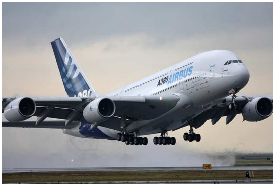
Atterrissage de l'A380 à Genève

L'avion descend sur une pente finale stabilisée à la vitesse d'atterrissage .